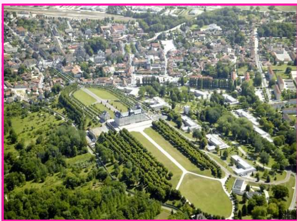
Vue aérienne de Brienne-le-Château

Les périodes les plus connues de l'histoire de Brienne restent la jeunesse de Napoléon à l'école militaire (1779 à 1784), son passage en 1805, suivie des terribles batailles de la Campagne de France en 1814.